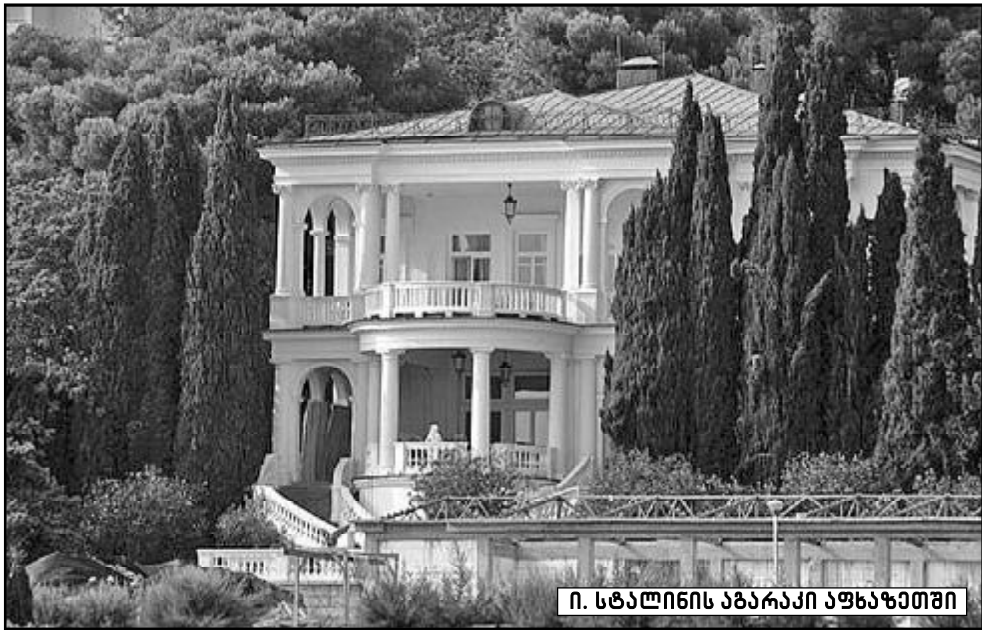
ი. სტალინის აბარაკი აუხაზეთში

გაბრასთან ახლოს, ზღვის დონიდან მთაში 950 მეტრის სიმაღლეზე არის მეტად თვანარმტაცი ტბა — რინა, რომელიც ასე გგონია, ქვაბურშია — მის ირგვლივ ცისკენ აზიდული, წინწოვანი ტყით დაფარულ