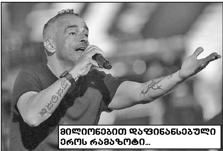
მილიონებით დაფინანსებული ეროს რამაზოტი...

ისე აშენდა იმისი ოჯახი, ვინც მინისტრს ამგვარი აზრი ჩაანვეთა! ხოლო თუ არავის ურჩევია და თავისი ნააზრევი მოგვახსენა, თანაც აპლომბით — ეს პროექტი მთავრობის ინიციატივაა და მისივე მხარდაჭერილიაო, მართლაც კარგად ყოფილა ჩვენი საქმე. მაშინ, მართლაც, ვაი ჩვენს