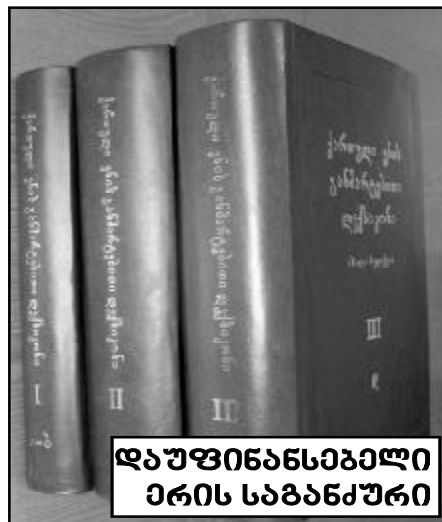
დაუფინანსებალი ერის საგანძური

არნოდ ჩიქობავას რვატომეულის გამოშვებას კი 150 მაღალკვალიფიციური მუშაკი ემსახურებოდა) და მათთვის ხელფასის ორი ათას ლარამდე გაზრდა.