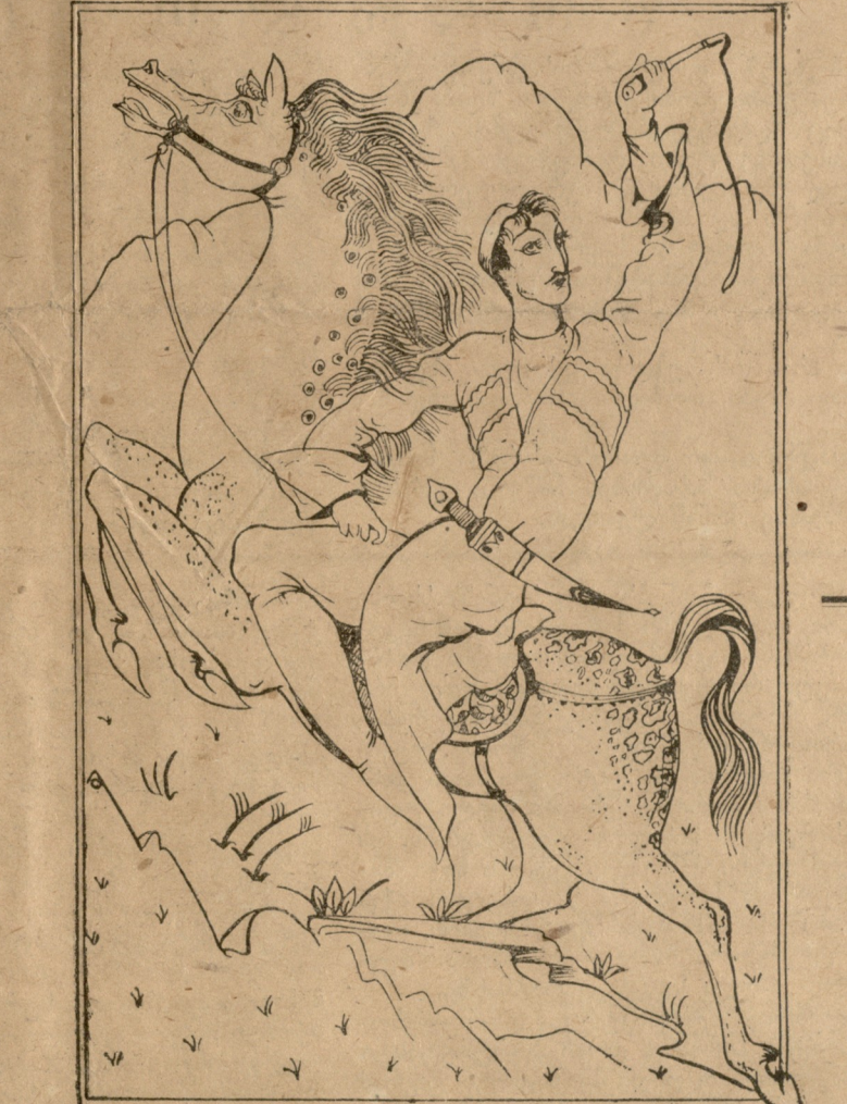
გადავდება ცხენზე არსენ, ქიხისკენ გამოსწვება...