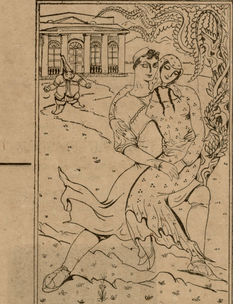
ბატონს მოხატვა მოახლე, ახალციხის გაუყენა...