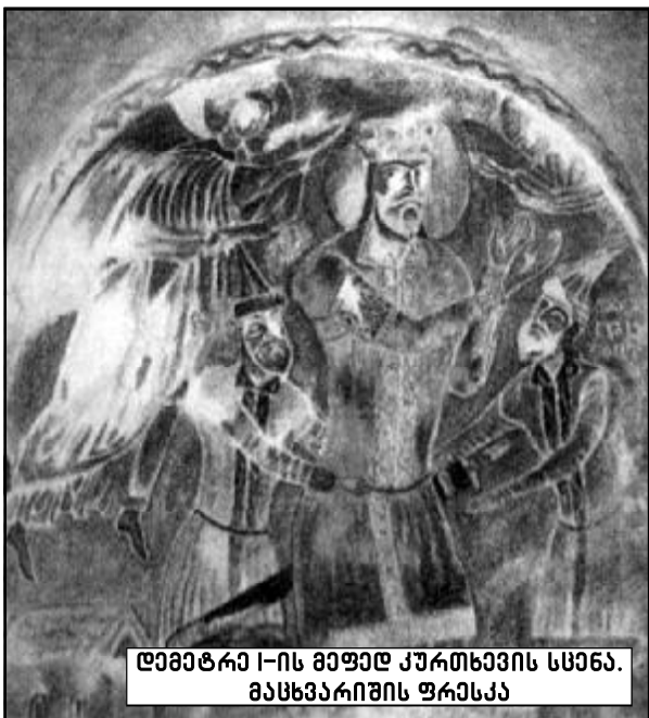
დემეტრე I-ის მეფედ ქურთხევის სცენა. მასხპარიშის ფრესკა

რაკი მაჰმადიანებმა უკან დაიხიეს, საქართველოს ლაშქრის თავკაცობას და თვით გიორგი მეფეს საქმე დამთავრებულიად მოსჩვენებიათ. განცხრომისა და დროსტარებისათვის მოუცლიათ. მოწინააღმდეგეებს კი ლაშქრობის დამთავრება არც უფიქრიათ. პირიქით, მათ საქართველოს ლაშქრის მდგომარეობის დაზვერვა მოახერხეს სხვადასხვა გზით და ანისს შეუტიეს. ეს ქართველთათვის იმდენად მოულოდნელი იყო, რომ წინა-