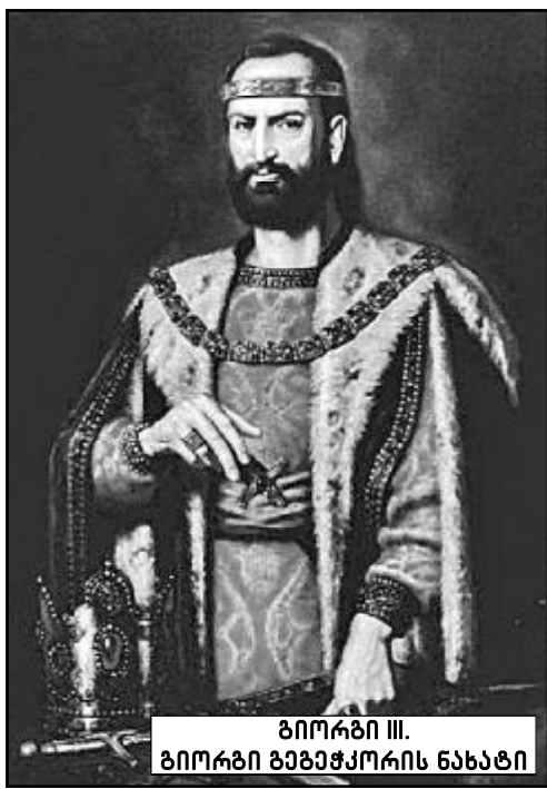
გიორგი III. გიორგი ბაგრატიონის ნახატი

მხედართუფროსები დაითანხმეს მეფის წინააღმდეგ გამოსვლაზე. საჭირო იყო მოსახლეობასაც შეენყო ხელი აჯანყებულებისათვის. აჯანყებულთა შთაბეზების მიხედვით, პირველნი შატის, პერთისა და კახეთის მხარეების მთავრები აჯანყდნენ. ხოლო კაიანისა და კაიწონის მმართველები თავიანთ ციხეებში გამაგრდნენ და მათი მოსაზღვრე მეფის მხარეები აიკლეს. ამის შემდეგ დემნა უფლისწულის, ამ „ახალი მეფის“ მეთაურობით (რომელიც ორბელებმა გადაბირებით აგარაკის სიმამრები მიიყ-