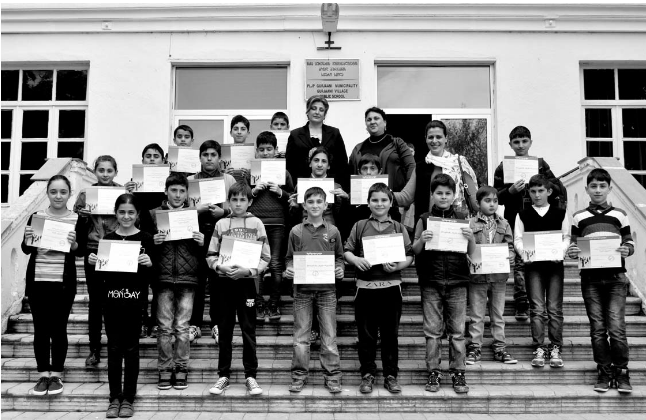
პროექტის მონაწილე მოსწავლეებს გადაეცათ სერტიფიკატები