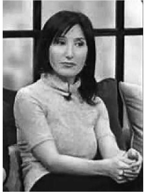
სები კი – სამდონიანი. ვინცებთ ელემენტარული დონიდან და მეორე, მესამე დონის საკომუნიკაციო შესტური ენას ვასწავლით, რათა ადამიანებმა ყრუ პირებთან, გარკვეულ დონეზე, კომუნიკაცია შეძლონ.

ამ შემთხვევაში ორი მიმართულება არსებობს – სმენისარმქონე/ყრუ პირთა და სმენის დაქვეითების მქონე მოსწავლეთა განათლება. პირველ შემთხვევაში, ყრუ პირთა სწავლებისთვის შემუშავებული გვაქვს შესტური ენის კურსები, რომელიც სხვადასხვა სამიზნე ჯგუფისთვისაა განკუთვნილი – როგორც თავად ყრუ პირებისთვის, ასევე მათი უახლოესი გარემოსთვის. ამის მიზანი კი არის, რომ შესტური ენის სწავლებასთან ერთად მათ შესტური ენის გარემო შეუქმნათ. მაგალითად, თუ ჩვენ მოგვმართა პირმა, რომელიც ყრუ სტუდენტის თანაკურსელია ან ყრუ მოსწავლის თანაკლასელი, მეზობელი, ოჯახის წევრი ან ნათესავი, ჩვენ მიერ შეთავაზებული კურსით, მათ შესტური ენა შეეასწავლით. შესაბამისად, ოთხი სამიზნე ჯგუფი გვაქვს – ყრუ პირები და მათი თანატოლები, ყრუ პირთა ოჯახის წევრები, მასწავლებლები და თარჯიმნები. თარჯიმანთა კურსები ორდინიანია, დანარჩენი კურ-