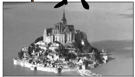
მონ-სან-მიშელის ციხე -ნორმანდია