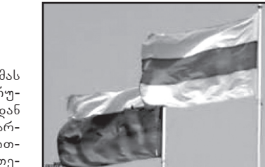
თი წლით უნდა გადაიდოს. მისი თქმით, წინასწარჩვენო ნელინადს რეფერენდუმის თემა ზედმეტად პოლიტიზირებულ ხასიათს იღებს.

რამდენიმე კვირის წინ მას ჰქონდა პატივი, შესევედროდა რუსეთის პრეზიდენტს. მოსკოვიდან დაბრუნებულმა ბრიფინგი გამართა და სურათი ისე დახატა, თითქოს პუტინი მზად იყო, მიეერთებინა ცხინვალს.