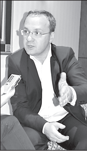
მაგრამ ვერც ერთხელ ვერ მივიღე პასუხი.

თუ ჩვენ საერთო სურათს შევადარებთ, მივიღებთ, რომ ვერც ერთი