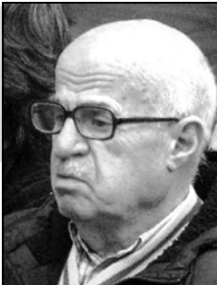
ლოდ რუსეთის კარნახი აკეთებს საქართველოს ხელისუფლებას?

პანკისის ხეობაზე რუსეთთან სამხედრო დარტყმა შეხდებოდა. ეს ხეობა სხვადასხვა დროს, წლების განმავლობაში, რუსეთისთვის საქართველოსზე ზეწოლის არადაც იყო გამოყენებული. რუსეთი ხშირად საუბრობდა პანკისში ტერორისტების არსებობაზე და საქართველოს და წერტულში მისი შემოქრის საბაბს ე უბდა. შესაბამისად, ამ კუთხეში საქართველოს ხელისუფლების ოფიციალური შესუსტების საშუალება იქნებოდა.