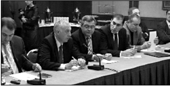
პარლამენტის ბიუროსის სხდომაზე.

„ალიანსი საქართველოს“ ხელისუფლებამ შესაძლოა თამაშვარე მეტოქეობაში დატოვოს. ეს „თამაში“ ნაციონალურმა ენდიაის ოფისში დაიწყო, რასაც ალიანსიც აყვავდა. თუმცა, მაშინ არაფერ არ მოელოდა, რომ ხელისუფლება პირველ ტაიმს მაინც არ დაასრულებდა და მოედანს ასე შეუნდებდა დატოვებდა.