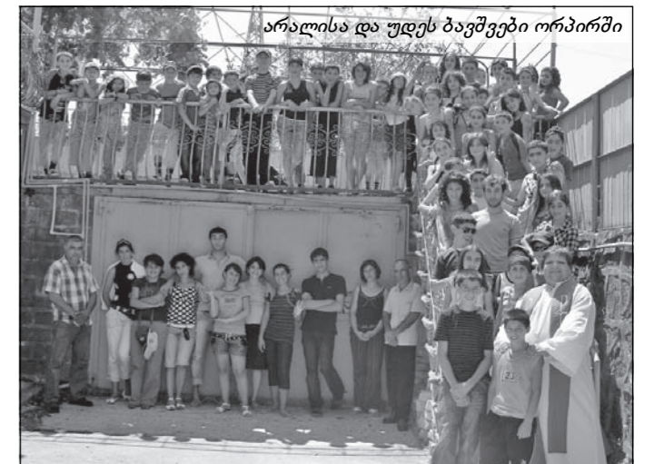
არალისა და უღეს ბავშვები ორპირში