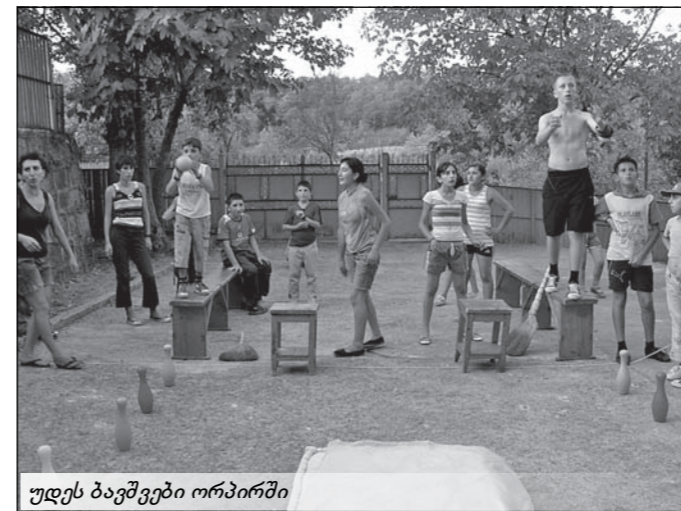
უღეს ბავშვები ორპირში