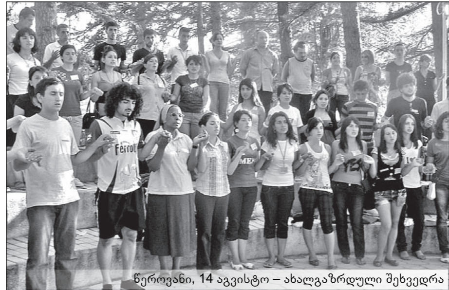
წეროვანი, 14 აგვისტო – ახალგაზრდული შეხვედრა

მისამართი: თბილისი, ვია აბესაძის ქ. №4 ტელ.: 98-95-16 რეგისტრაციის № 1853 დაარსდა 1994 წ. მანანა ანდრიაძის მიერ © „საბა“, 2010