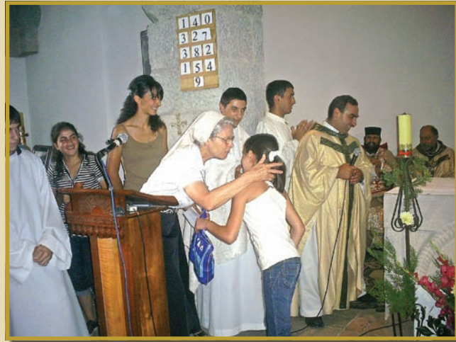
ვალეს ეკლესიის დღესასწაული