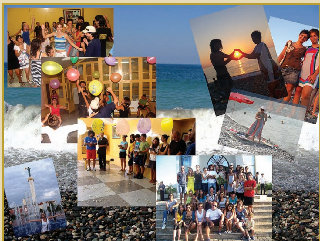
კათედრალის ახალგაზრდები ბათუმში