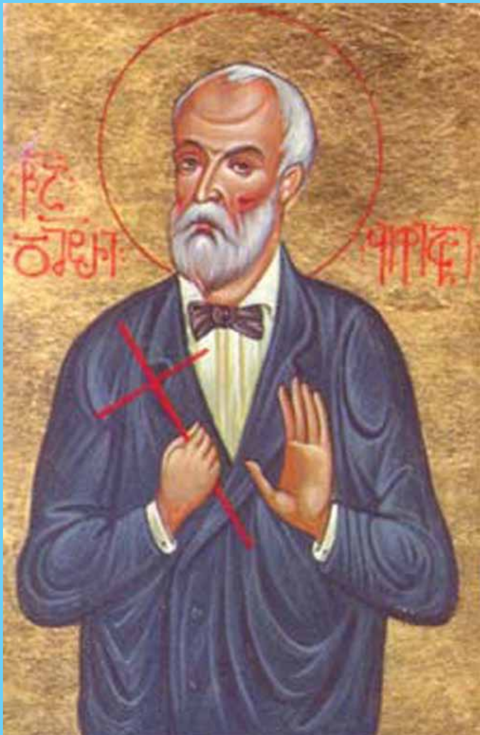
წმ. დიმიტრი გოგიასანი