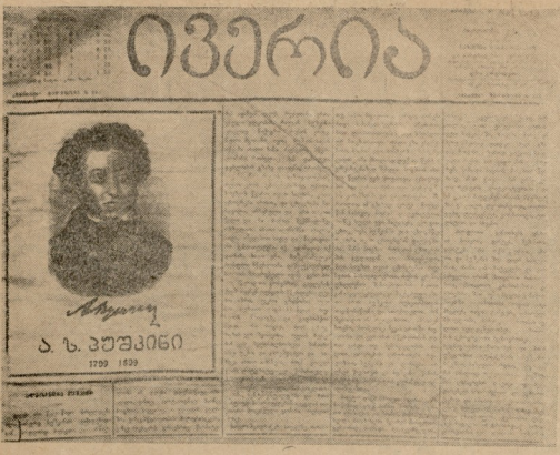
გაზეთი „ივერია“ (1899 წ.) მიძღვნილი ლა პუშკინის ხსოვნისადმი პოეტის დაბადებიდან 100 წლისთავის შესრულებას გამო.