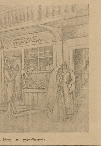
პუშკინი თბილისში (ფანჯარა) ნახ. პროფ. ლ. ვუღიაშვილისა.