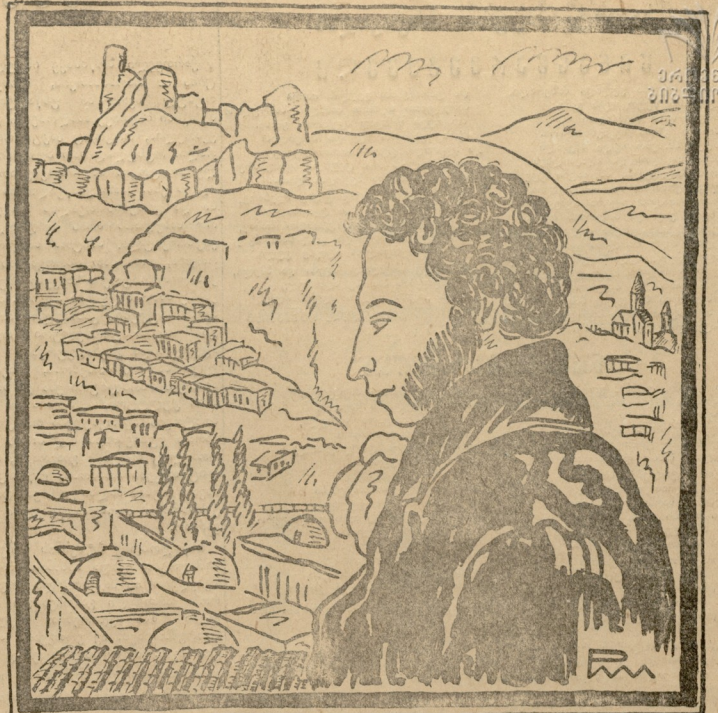
პეტრ სეზავაი თბილისში ნახ. რ. ლორის-მე-ლიკოსისა.

ამ ხანაში ქართული ინტელიგენცია... (პეტრ სეზავაის მიხედვით)