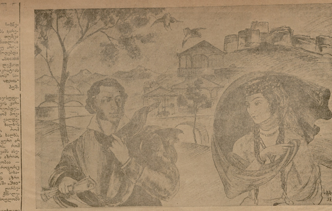
„პირველი შეხვედრა, თბილისში“ — ნ. ა. კეცხაველის.

პუშკინი არა თუ არ მოითხოვდა პოეტისგან გამოვიდეს ხალხს ცხოვრებას, არამედ, როგორც მხატვრული რეალიზმის ფუნდამენტური პრინციპი, სხვებზე უფრო მეტად უნდა იყოს დაკავებული ხალხის ცხოვრებით. პუშკინის აზრით, პოეტის მთავარი მოვალეობა — ხალხის ცხოვრების დასახელებაა.