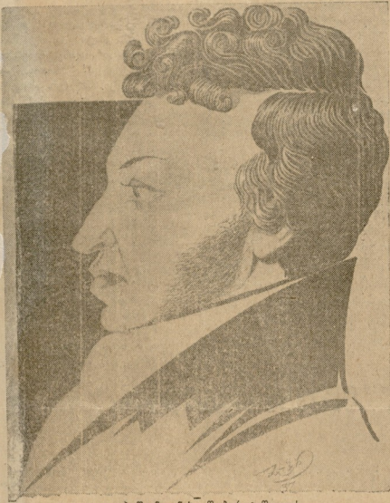
ბ. პოლენოვი - ნახ. მ. გრიგორაშვილისა.

ბორის პოლენოვი... (ბორის პოლენოვის მიხედვით)