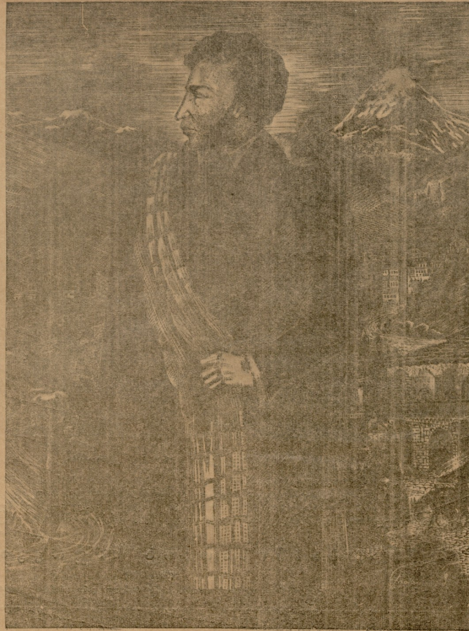
პუშკინი თბილისში (გრაფურა ხეზე) — კ. უთაბაძის.