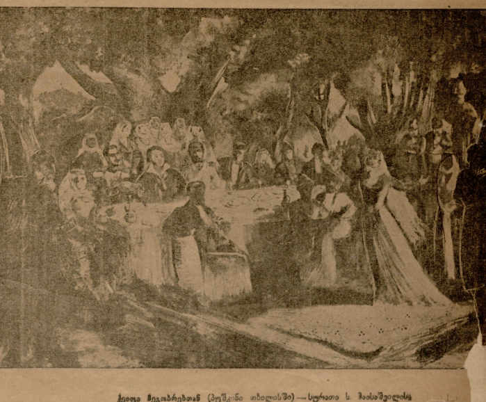
ქვირა შევაჯობან (პუშკინი თბილისში) — სურათი ს. შაპისევილის