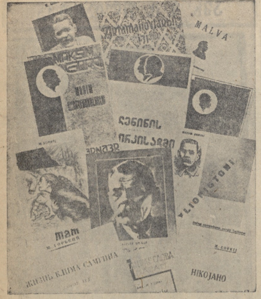
გორის ნაწერები და წიგნი გორაკი საბჭოთა კავშირის ხალხთა სხვა და სხვა ენებზე