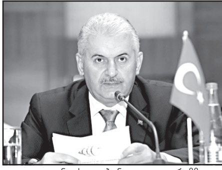
თურქეთის პრეზიდენტი რეჯეფ ტაიპ ერდოღანის თქმით, სომხეთს ბენოციდის შესახებ რეზოლუციის მიღება დიდ გავლენას მოახდენს თურქეთ-გერმანიის ურთიერთობაზე. პირველი ნაბიჯის სახით ვინცე ვთქვით, ბერძნის ბენოციდის აღიარებასთან დაკავშირებით, თურქეთის პრეზიდენტი რეჯეფ ტაიპ ერდოღანის თქმით, სომხეთს ბენოციდის შესახებ რეზოლუციის მიღება დიდ გავლენას მოახდენს თურქეთ-გერმანიის ურთიერთობაზე. შესაბამისი შეფასების შემდეგ ყველა საჭირო ზომას მივიღებთ, - განაცხადა თურქეთის პრეზიდენტმა.

ეს არასწორი გადაწყვეტილებაა. თურქეთი ხალხის წარსული ყველასთვის ცნობილია. ჩვენი ერთი ამავალბან თავისი წარსულიდან არ ვხედავთ.