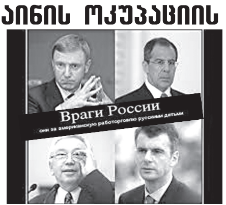
დარღვენი ფიქრობს, რომ უკრაინის დამოუკიდებლობა მისი დასავლეთი რეგიონის უნდა შემოიფარგლოს. რუსეთის მტრებს შორის მესამე ადგილი თურქეთს ერგო. ასე მიიჩნია რუსების 10%-ს. აქედან 70% მიიჩნევს, რომ რუსეთმა უნდა შეიერთოს თურქეთის ის ტერიტორიები, რომლებიც ადრე სომხეთს ეკუთვნოდა და ხელი შეუწყოს ქურთების ავტონომიის შექმნას, რომლის დაფუძველზეც მომავალში ქურთისტანის დამოუკიდებელი სახელმწიფო შეიქმნება.

რუსეთის მტრებს შორის მეორე ადგილი უკრაინას ერგო. ასე ფიქრობს რუსეთის მოქალაქეთა 20%. შეკითხვაზე, როგორ უნდა იყოს უკრაინისადმი რუსეთის პოლიტიკა, 71%-მა უპასუხა, რომ უნდა მოხდეს მთელი უკრაინის ოკუპაცია. 12% მიიჩნევს, რომ რუსეთმა უნდა შემოიერთოს როგორც უკრაინის სამხრეთ-აღმოსავლეთი რეგიონები (ე.წ. ნოვოროსია), აგრეთვე კიევიც. დასავლეთ უკრაინის პოლიტიკური შეერთებას მხარს უჭერს რუსების 78%.