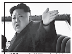
ჩრდილოეთ კორეის დიქტატორი კიმ ჩენ ინსა

ჩრდილოეთ კორეის მთავრობა ცნობილია საეჭვო ფინანსური ოპერაციებით და ამის სათანადო რეაგირების გარეშე დატოვება შეუძლებელია, - ნათქვამია აშშ-ის ფინანსთა სამინისტროს განცხადებაში.