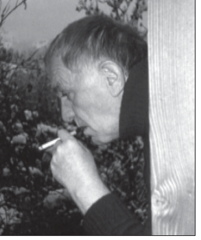
მეგობრია შენი კეთილი გულის სით... როგორ ჩურჩულედი ხოლმე თვალმინაბული, პურისის ვაშ მეგობრებს წრეში? „წუთისოფლი რა არი, ავტობუსი ქვა არი, როგორც კი დავიბადე, იქვე საბარო მზა არი“. რა უნატი, ასე ყოფილა და ასე იქნება ამ ცხოველებში... ღმერთმა ნათელი ამყოფოს შენი ლამაზი სული!