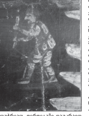
ამოუკრებით, ფიროსმანს დაუკრავთ და ცალკე გაუყვით. ორივე ნაწილი დღეს საქართველოს მულა ამირანაშვილის სახელმწიფო მუზეუმში ინახება. წლებს მანძილზე იგი დახვეული იყო, 60-იან წლებში გაუხსნილი, ნახევრებში პაპირსებში დაუკრავთ და ისევ შეუნახიათ.

დასწავლილი ერთი წელიწადი დასტურდება ნიკო ფიროსმანის ფერწერული ცილის „ნაღობი ინტელიტში“ რესტავრაციას. მხატვრის ამ ერთ-ერთ დიდ (114X251) ცილის მინიშნული აქვს განსაკუთრებული კვანძგორია და დღეს უმძიმეს მდგომარეობაშია. 1913 წელს მუსრულებულმა ნამუშევარმა ჩვენამდე უპირავე ბზარითა და მუშაობის ჩანახევებით მოაღწია და ფაქტობრივად დასაბუთებელი განწირულია.