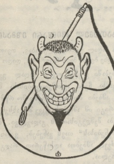
ზოგიერთი ტიპური არსებანი

— ამას წინათ რიდალქიში შევიარე, —გამობოზბთ ის, — ამა, მოვიდა ჩემი ახალგაზდა მწერალი, მამახანს, თითქმის იქ იყვენ ყველა ჩემი რჩენული მწერლები: პოეტი №, კრიტიკოსი X (ქერქტაძე ჩამოთვლის ყველა რჩენულ მწერლებს). თიხულბეჭდენ ხელნაწერს მოთხრობა უწარმო და საბეჭდათ გამოზგანინის. მე ძალიან მომეწონა მოთხრობა, —