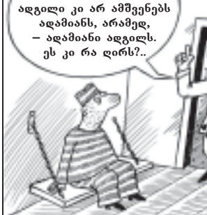
ადგილი კი არ აშენებენ ადამიანს, არამედ, - ადამიანი ადგენს. ეს კი რა ღირს?..