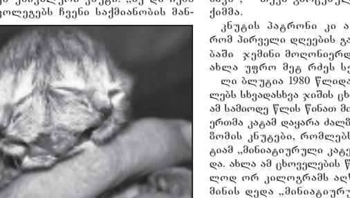
რომეზურველ ვეკერიონარს აღწერს როსს ჯერჯერობით არ შეუძლია მუსტად

ამერიკის ორთაყვანიანის შტატის ქალაქ როზენბერგში გაჩნდა კნუტი, რომელიც ორი პირი, ორი უნა, ორი ცხვირი და ოთხი თვალი აქვს. ახალშობილს ჯემინი შეარქვეს. „ძალიერ შებრალება იგი, რადგან არ ვიცი, იყოფილებს თუ არა, – თქვა კნუტის პატერნმა 40 წლის დედას. – თუ კნუტი ცოცხალი დარჩება, იგი იქნება აბსოლუტურად ნორმალური განზრდილი კნუტი, ოღონდ ორი „სახი“.