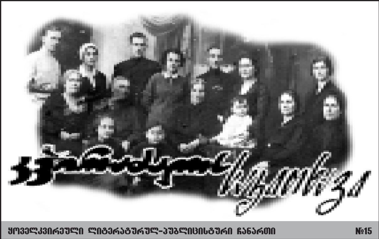
ყოველკვირადევი ლიტერატურულ-კულტურული ჩანართი