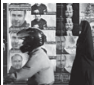
პრეზიდენტის პოსტი ირანში არ არის უმალესი თანამდებობა. ქვეყნის სულიერი ლიდერს აიათოლა ჰამენეის მუგე ძალაუფლება აქვს, და

ირანი 47-მილიონიანი მოსახლეობა ირანის ქვეყნის პრეზიდენტს ამ არჩევნებზე ბრძოლა, როგორც მიმოხილვებში ვხვდებით, უნდა გახდეს ყველაზე მწვავე 1979 წლის ისლამური რევოლუციის შემდეგ.