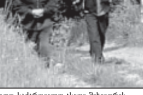
დედო, საქართველო ასეთი შეხვედრის წინააღმდეგია...