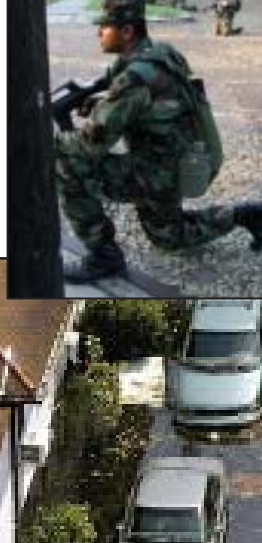
სტიქიის შედეგად დაზარალებული უმრავლესობა შეკანიაინი დარბაზი ადამიანები არიან...