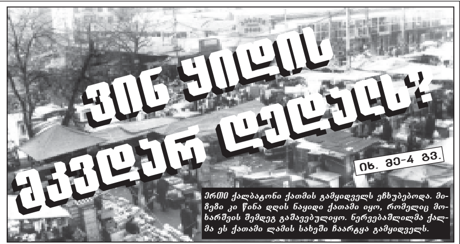
ნ. ბა-4 გვ.

ვინ ყილის ეკვლურ ლეღებს? მრთი ქალბატონი ქათმის გამოყვლეს ეჩხებებოდა. მი- მები კი წინა დღის ნაყიდი ქათამი იყო, რომელიც მო- ხარშვის შემდეგ გამოყვებულიყო. ნერვებაშიღია ქალ- მა ეს ქათამი ლამის სახეში ჩაარგვა გამოყვლეს.