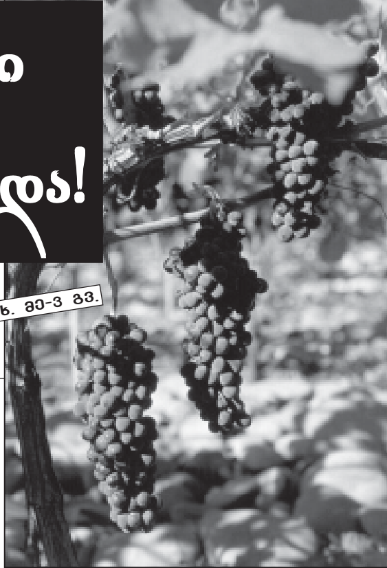
ნ. ბა-3 გვ.

მინდვრად კი თავთაშიანები ასაღებია და ვენახის დასაპრეზია