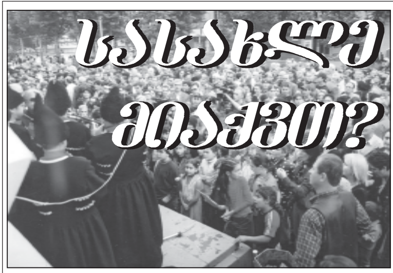
ნ. ბა-2 გვ.