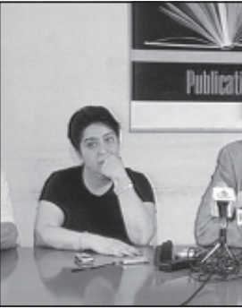
რეგულაციების აღმასრულებელი დირექტორი...