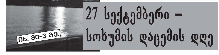
27 სექტემბერი - სოხუმის დასახლების დღე

ტომოში 2005 წლის აპრილში. მინორიტეტის განვითარების მიზნით საქართველოში მიხროსი კაბა ღია და სკოლაში შესვლა შეუძლებელი გახდა. ეს არის დასტურია, რომ სკოლაში შესვლა გამორჩეულად უფრო ადვილად აქვს ეროვნულ უმცირესობათა სწავლა-განათლებლას მათ მშობლიურ ენაზე.