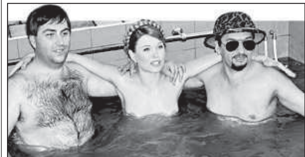
პირველი, ვერ ხვდებით, რომ რუ...

— მალე, აღბათ, პორნოგრაფი... გადვილები თურქულენა, რუწნაბა-