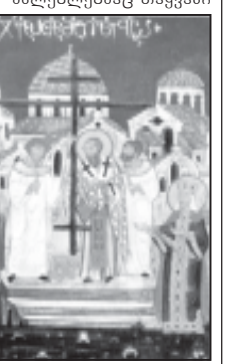
სცეს ჯვარი, რომელიც პატრიარქმა და სამღვდლოებამ აღაძაღვლა. მოამბა ბიული ლიპარტიანი.

ჯვარზე იყო აგებული, ყველამ იგრძნო კეთილსურნელება, აღმოაჩინეს მაცხოვრის სამარხი, გოლგოთა და სამი ჯვარი. იმისთვის, რომ შეეტყუოთ, რომელი იყო უფლის ჯვარი, პატრიარქმა რიგრიგობით შეაბო ისინი ერთ ახალ მიცვალებულს ცხოველმყოფელი ჯვარის შეზღაურებით მიცვალებულნი გატოვებულნი და იქ დაამსრვე მსახურებამაც თავყვანი