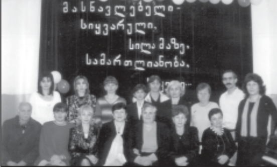
მასწავლებლები და ვედიკანტები. მასწავლებლები და ვედიკანტები.

უფრო მეტი უნდა იყოს. უფრო მეტი უნდა იყოს. უფრო მეტი უნდა იყოს.