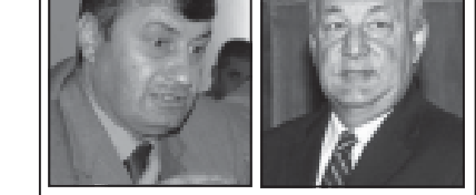
მედიაცია. მედიაცია. მედიაცია.