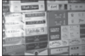
აღმოჩენილი კონტრაბანდი. აღმოჩენილი კონტრაბანდი.

ქაშის რაიონის სოფელ იმეთთან აღმოჩენილი კონტრაბანდი. აღმოჩენილი კონტრაბანდი.