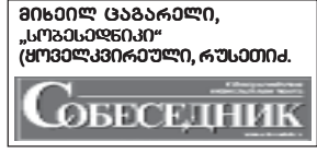
„სოხელი“ - ახალი ტენდენციები. „სოხელი“ - ახალი ტენდენციები.