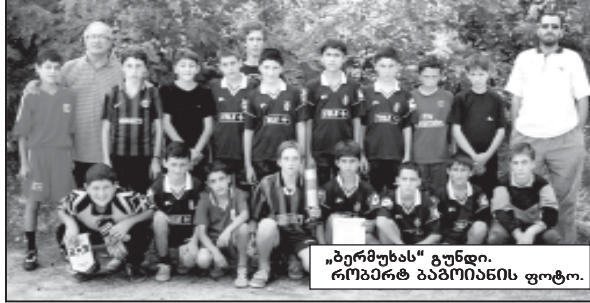
„ბერძენის“ გუნდი. რამდენიმე ბავშვიანი ფეხბურთელი.