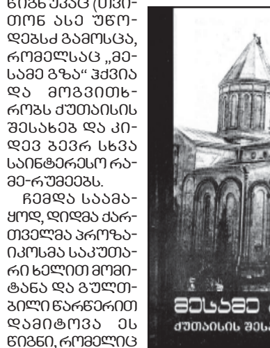
მესამე გზა - შუბისი შენობა და სხვა...