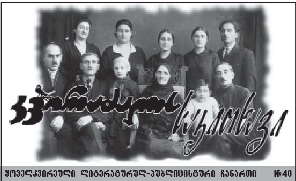
ყოველკვირეული ლიტერატურულ-კულტურული ჩანართი № 40