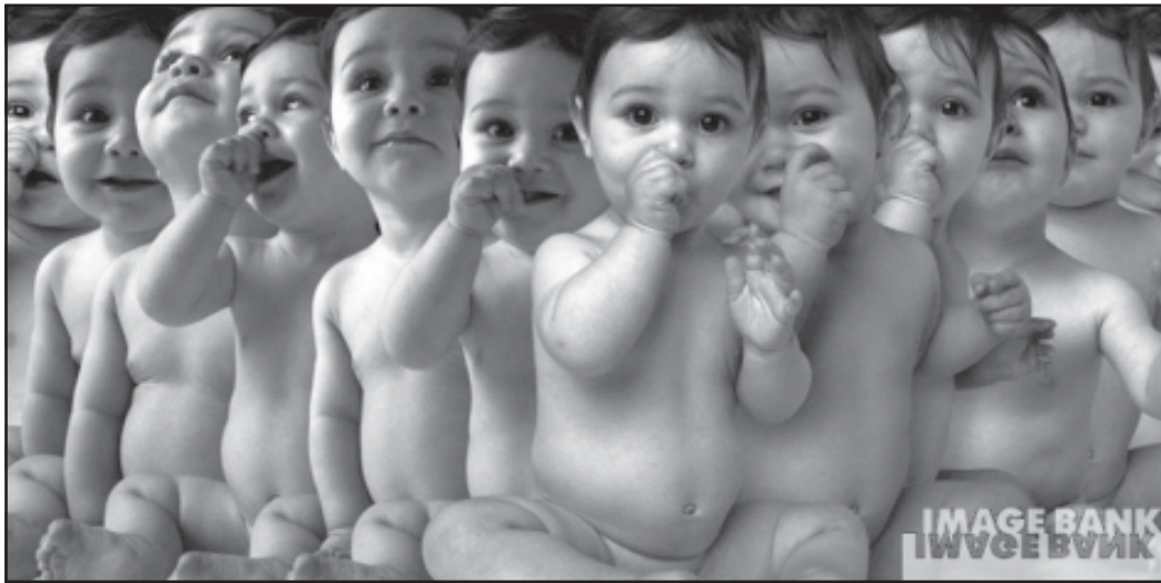
მყოფობა, რომელიც უპვილო-ზას უქმინან საფრთხეს, მაშინ იჩენს თავს, როცა ძალევი კრიტი-კულ დღეთა „არაუქმებულ-ბის“ (ან სხვა პრობლემაში მ-ზებით მიგართავენ ეძიეს).