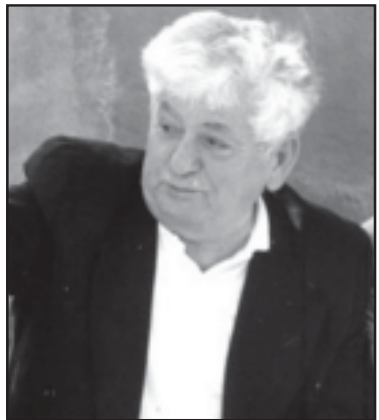
ამონარიდი ნივთიდან: არა მითი, არა მშვიდობით, - მესამე გზა!