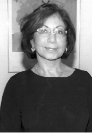
Ривка Козин, посол Израиля в Грузии