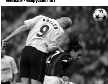
Лидер дортмундской «Боруссии» чешский гренадер Ян Коллер.

«Локомотив» Москва - «Реал» Мадрид 0:1. Московский «Локомотив» потерпел пятые поражение во втором групповом раунде Лиги чемпионов.