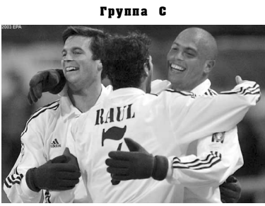
Группа С. Слева направо: Рауль, Милан, Ювентус, Реал.

«Мертвый» мяч после удара с близкого расстояния Вадима Евсеева.