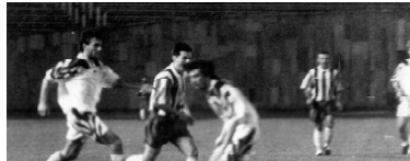
Корнуш во время матча «Локомотив» - «Спартак».