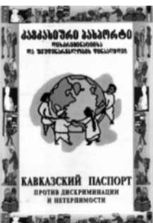
КАВКАЗСКИЙ ПАСПОРТ ПРОТИВ ДИСКРИМИНАЦИИ И НЕПРАВИДИТЕЛЬНОСТИ