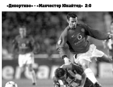
«Депортиво» - «Манчестер Юнайтед» 2:0.

Лидер дортмундской «Боруссии», чешский гренадер Ян Коллер, на 80-й минуте забил победный гол в ворота «Милана».