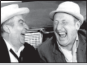
რუსს არ უყვარს ხევის დაკრულზე ცეკვა, მაგრამ ხევისი არცის სხვაზე გივდება.

ზორბარკიძან დარწმუნებ გაიქცა... თუმცა, შესაძლოა, ლომები ყველაფერს ბოლომდე არ ამბობდნენ.