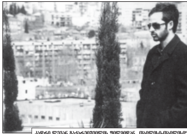
პატივსაცემი ლევან ზაქარაიშვილის ფილმით „თბილისი-თბილისი“.

გავაზილია ლევან ზაქარაიშვილის ფილმი „თბილისი-თბილისი“. თურმე დეზულებით ერთ ქვეყანას მხოლოდ ერთი ფილმის წარდგენა შეუძლია, მაშ, როგორღა მოხდებოდა იქ მოკრე ქართული ფილმი?