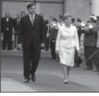
გაუქმდა საქართველოს პარლამენტში ხელი მოეწერა შეთანხმებასა