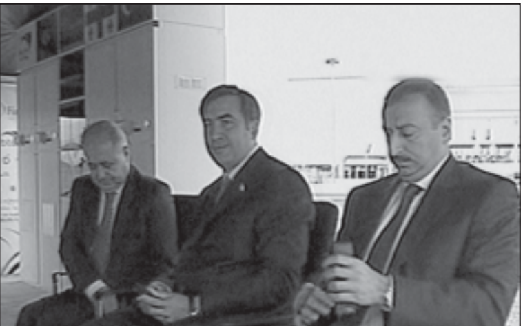
ბაქო-თბილისი-ჯეიჰანის ნავთობსადენის საქართველოში მშენებლობის დასრულების საზეიმო ცერემონია. სადღესასწაულო ღონისძიებას საქართველოს პრეზიდენტი მიხეილ სააკაშვილი მასპინძლობდა. ღონისძიებას აზერბაიჯანის პრეზიდენტი ილჰამ ალიევი, თურქეთის პრეზიდენტი აჰმედ სეზერი, BP-ის მთავარი მენეჯერი იან კონი და სახელმწიფო მოღვაწეთა დიდი ჯგუფი ესწრებოდნენ.