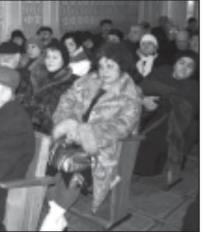
სსდომის 15-ე სესიის დასრულების შემდეგ...