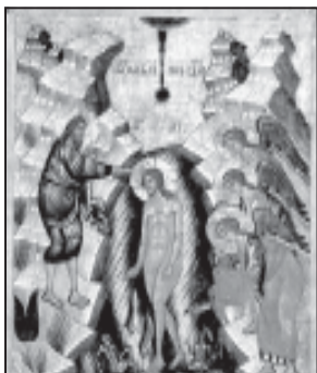
სოფლისმცოდნეობის დარგში უფლისა ღმრთისა და მაცხოვრისა ჩვენისა იესო ქრისტესი...