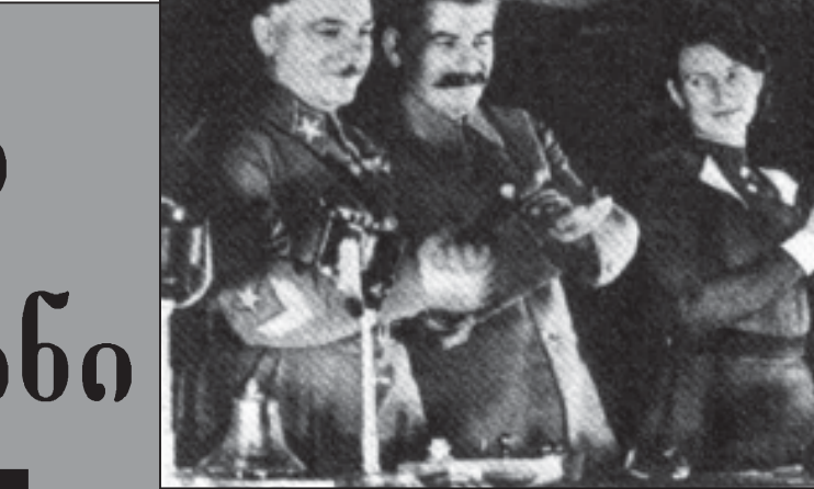
მან ბანერალი ვლასი ბაიბი...