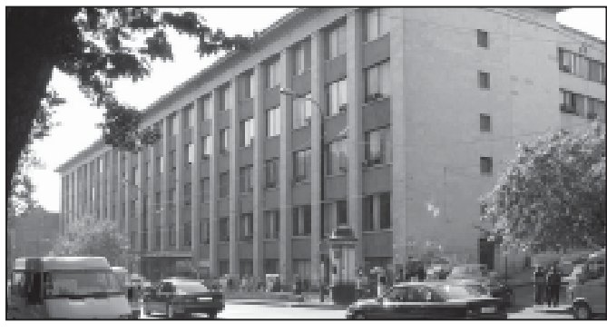
პარკის მდებარეობის ახალი არ...

მთავრობის განცხადებით... (text continues)