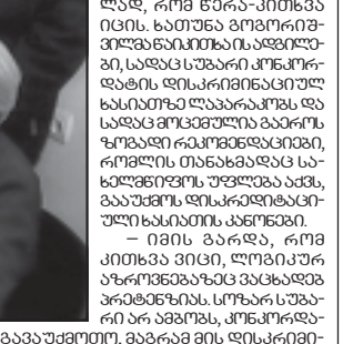
მთავრობის განცხადებით... (text continues)