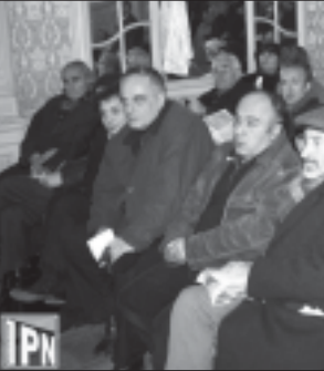
სსდომის 15-ე სესიის დასრულების შემდეგ...