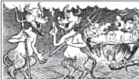
ჩვენც რომ პრინციპული მფარველებითი ძვირად...