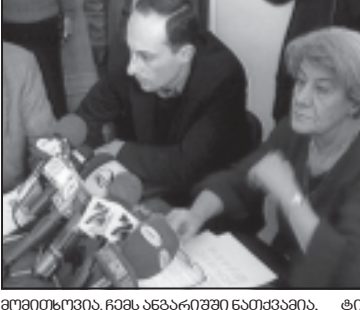
მთავრობის განცხადებით... (text continues)