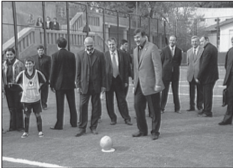
იხ. გვ-2 გვ.

ფილიალის გახსნის შემდეგ საქართველოს პრეზიდენტი მცხეთის პოლიციის სამმართველოს ეწვია.