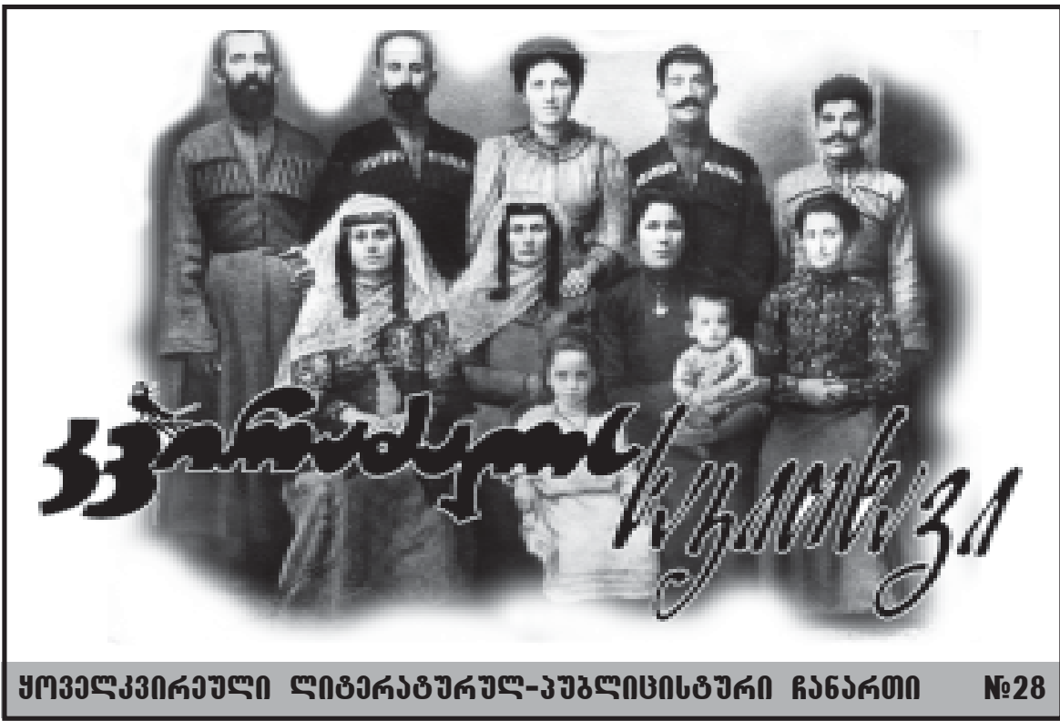
ყოველკვირეული ლიტერატურულ-კულტურული ჩანართი №28