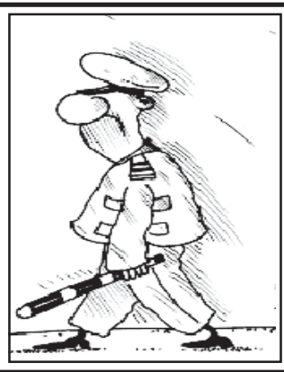
იხ. გვ-20 გვ.