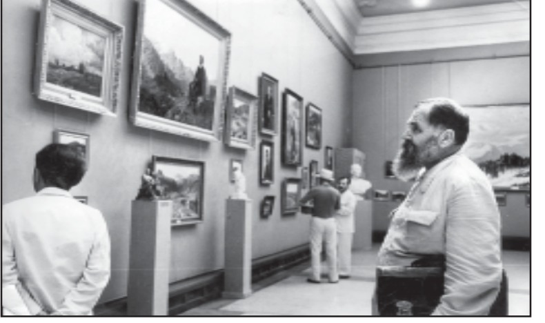
თბილისის სამხატვრო გალარეა, გალაკტიონ ტაბიძე ათვალიერებს სამხრეთ ოსეთის მხატვართა ნამუშევრების გამოფენას. 1956 წელი.

წინათ... გალაკტიონ ტაბიძის არქივიდან სოხუმის სასტუმროში შედგენილი ლექსების რვეული