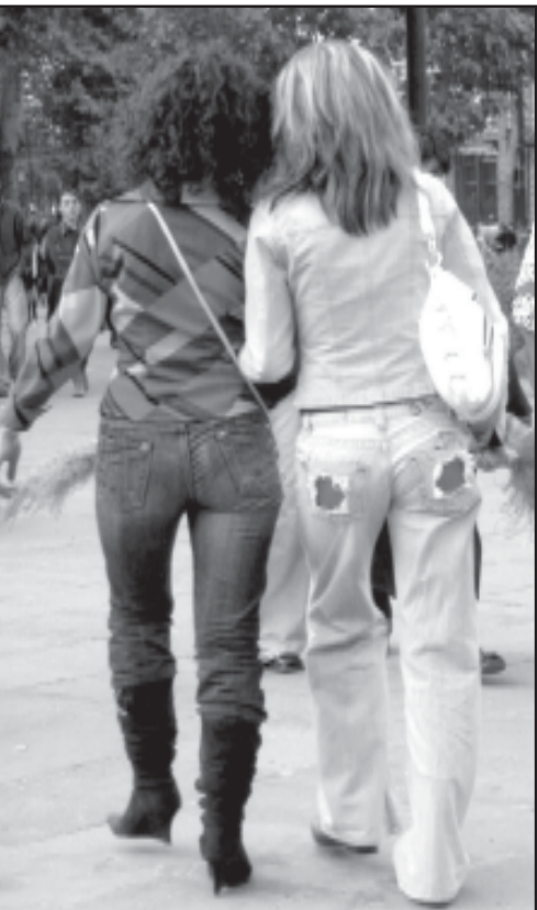
ამას რას ხედავს ჩემი თვალები!!!