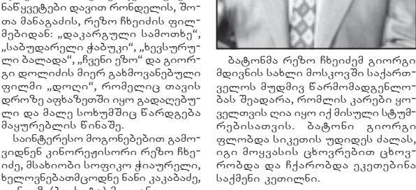
საზოგადოებრივი: 100 წელი შეიქმნა საქართველოს მწერლისა და კინორეჟისორის კარლო კორნელიძის დაბადების 100-ე წლისთავს...