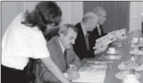
ხელშეწყობაზე ხელმძღვანელები, — თბილისის საავიაციო უნივერსიტეტის რექტორი...