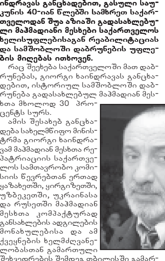
სახელმწიფო მინისტრის გიორგი ბინიაშვილი