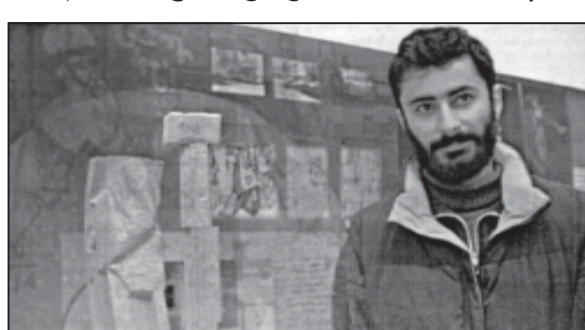
კვირის არსი მდგომარეობის იმპია, რომელიც გარკვეულ განზოგადებულ ფორმებში...