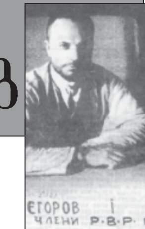
ე.გოროვ ი. ტ. სტალინის წევრი. რ. ვ. რ. ნივ. ზაქიძე. ფრონტი.