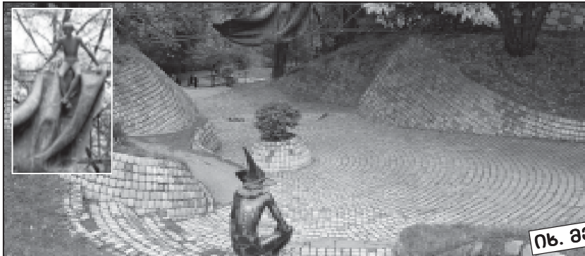
ნ. ბ-3 გვ.