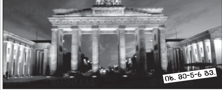
იხ. 80-5-6 გვ.

გერმანიის ფედერალურ რესპუბლიკაში საუბარი არა მარტო იმით არის გამოწვეული, რომ ამ ქვეყანამ საქართველოს დამოუკიდებლობის პირველ წლებში, ფასდაუდებელი დახმარება გაუწია, არამედ იმითაც, რომ გერმანია იყო ერთ-ერთი პირველი, ვინც ცნო მისი დამოუკიდებლობა და იურედ და თბილისში გახსნა საელჩო.