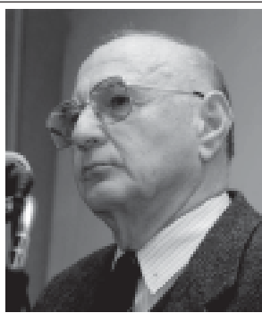
იხ. 80-2 გვ.

მეცნიერებათა აკადემია, ქართულ-სომხური კულტურული მეტოქეობა და „ქვანთა ღაღადი“