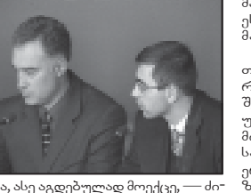
მა, ასე აგებულად მოეძებნა — ძირითადი თქმით, ამგვარი დამოკიდებულების გამო იმპიჩმენტის პროცედურას არ დაიწყებენ...