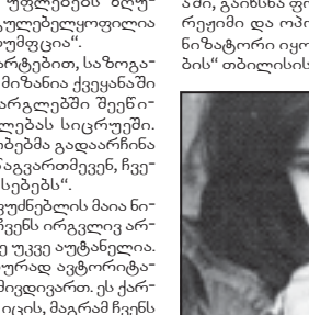
„ტოტალიტარული ტრანზიციის“ მხრიდან „ვარდების რევოლუციის“ მხრიდან „ვარდების რევოლუციის“ მხრიდან...