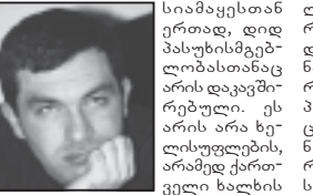
სამაყესთან ერთად, დიდ პასუხისმგებლობასთანაც არის დაკავებული. ეს არის არა ხელოვნების, არამედ ქართული ხალხის...