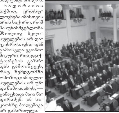
პარლამენტში დსთ-დან საქართველოს გამოსვლის პროცედურის დაწყებაზე კონსულტაციები იწყება.