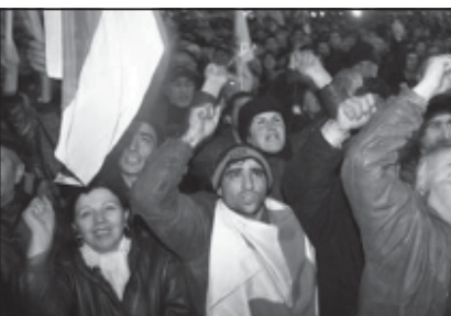
რომელიც საქართველოში სუფთად „ვარდების რევოლუციამ“ უწინარეს ყოვლია, უწინარეს განსაკუთრებით გაუფასავა...