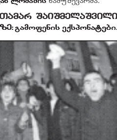
„ტოტალიტარული ტრანზიციის“ მხრიდან „ვარდების რევოლუციის“ მხრიდან „ვარდების რევოლუციის“ მხრიდან...