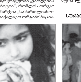
„ტოტალიტარული ტრანზიციის“ მხრიდან „ვარდების რევოლუციის“ მხრიდან „ვარდების რევოლუციის“ მხრიდან...