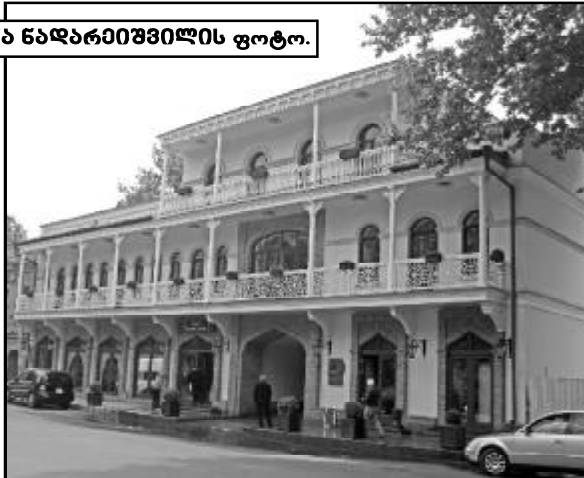
ელგუჯა ნადარეიშვილის ფოტო.