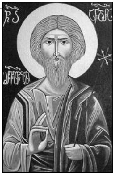
მონ კანანელი, თვითონ საბერძნეთში გაემგზავრა. იქ ნეტარი ანდრია ჯვარზე გააკრეს.

იმ ადგილას, სადაც მოციქულმა ანდრიამ ყოველდღე მონაღმრთო ღვთისმშობლის ხატი დაასვენა, ამოჩქევა მშვენიერმა წყარომ. მის გარშემო შემოიკრიბნენ იმ ქვეყნის მკვიდრნი და მოციქულმა ნათელი სცა ყველას სახელითა მამისათა და ძისათა და სულისა წმიდისათა. იქაურ ქართველებს მღვდლები და დიაკვნები დაუდგინა და სარწმუნოების წესი და საზღვარი დაუდო. ქართველებმა იქ ააშენეს ღვთისმშობლის სახელობის ეკლესია. ანდრია პირველწოდებულმა მოიარა საქართველოს სხვადასხვა კუთხე, ქადაგებით ჩავიდა ტაოში, სვანეთში, ოსეთსა და აფხაზეთში; იქ დატოვა სი-