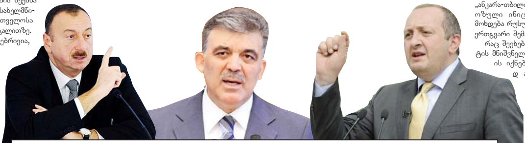
„ფაქტობრივად, სამხედრო ალიანსი გაფორმდა ბაქოსა და თურქეთის შორის, რაც გულსიმძობს იმას, რომ იმ შემთხვევაში, თუ მოხდებოდა აზერბაიჯანზე თავდასხმა, თურქეთი აღებული იქნებოდა ერთგვარ მურყის ფუნქციას. ბუნებრივია, ამ კონტექსტშიც ჩნდება საქართველოს ფაქტობრივ, მით უფრო, რომ სამხედრო ინტერვენციის საფრთხე ჩვენი ქვეყნის მიმართ დიდია“

რომ ერდოლანის დღევანდელი საგარეო კურსი, მიმართულია იქით, რომ თურქეთი გადაიქცეს, სულ მცირე, რეგიონულ სუბერსაბელმონივოდ და ბუნებრივია, ეს ყველაფერი შედის აი, ამ სტრატეგიის ფორმატში. იგივე უსაფრთხოების პირობების შექმნა კავკასიის რეგიონის სახელმწიფოებისთვის, საქართველოსა და აზერბაიჯანის მაგალითზე. ყველაფერი ეს, ბუნებრივია, არის გზავნილი რუსეთისთვის, გზავნილი იმისა, რომ სამ სახელმწიფოს შორის კიდევ უფრო ღრმადდება თანამშრომლობა და ამის ფონზე იმატებს თითოეული სახელმწიფოს უსაფრთხოების ხარისხი.