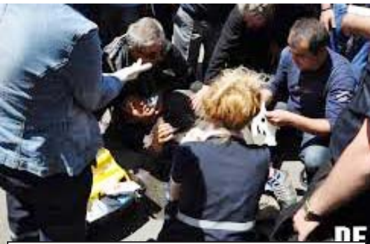
„მთელი პასუხისმგებლობით ვაცხადებ, რომ ეს არის წმინდა წყლის პროვოკაცია, საქართველოში ჩამოვლენ სხვადასხვა ევროპული ქვეყნიდან მოგროვებული კავკასიელი გეკევი, რომლებიც თავის ქვეყნებში არ ცხოვრობენ, ესენი იქნებიან ადამიანები, რომლებიც პირდაპირ მიზნულნი არიან სპეცსამსახურებს“

გაძლევთ, თუკი ამ გვიალღებთ მეურთოდებიან, საკუთარ ქვეყნებში ვეღარ დაბრუნდებიან. მთელი პასუხისმგებლობით ვაცხადებ, რომ ეს არის წმინდა წყლის პროვოკაცია, საქართველოში ჩამოვლენ სხვადასხვა ევროპული ქვეყნიდან მოგროვებული კავკასიელი გეკევი, რომლებიც თავის ქვეყნებში არ ცხოვრობენ, ესენი იქნებიან ადამიანები, რომლებიც პირდაპირ მიზნულნი არიან სპეცსამსახურებს. მოგვსენებათ, არატრადიციული სექსუალური ორიენტაციის ადამიანების კომპრომტებით გადაბირება ძალიან იოლია. ასე რომ, საერთო კავკასიური გეკევი უმისი ორგანიზაციების მიზმა რა ძალები დგანან, რომელი ქვეყნის სპეცსამსახურები მუშაობენ, ეს არის გასარკვევი. ძალიან შეგარება ეჭვი, რომ აზერბაიჯანმა და თურქეთის მხარე ეს პროექ-