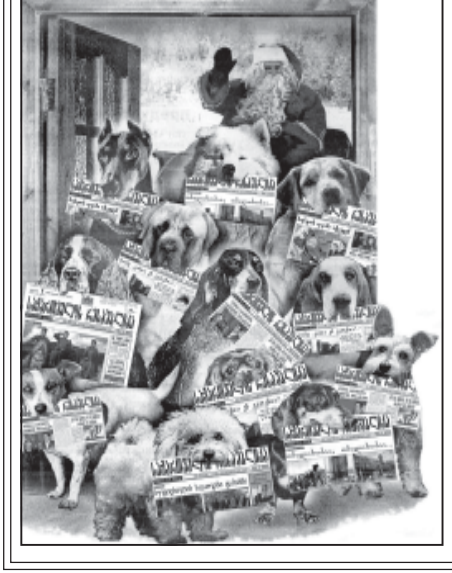
გაზეთის გამავრცელებელთა საყურადღებო დეკლარაცია

„საქართველოს რესპუბლიკის“ გაზეთის გამავრცელებელთა საყურადღებო დეკლარაცია. ჩვენ ვთხოვთ, რომ გაზეთის გამავრცელებელთა საქმიანობა იყოს გამჭვირვებელი და პატივსაცემი.