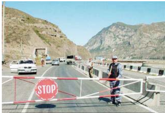
„სულ 700 ჩილი ამოაგდო კომპიუტერმა, ვისაც გადაკვეთილი ჰქონდა საზღვარი, მაგრამ აქ გასათვალისწინებელია, რომ რე-ესტრმა და საზღვარმა ვერ შეაჯერა ამ მიზნის უცხოური სა-ელები ქართულთან, იქ კი ყველა ასოს აქვს მიზნებელია“