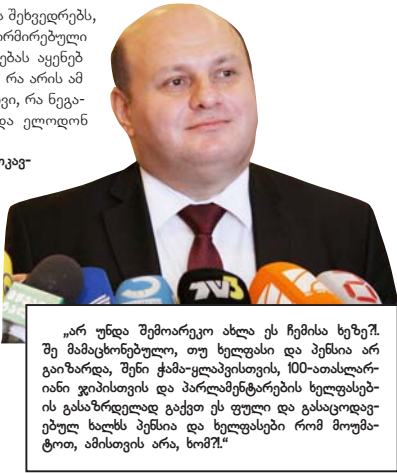
„არ უნდა შემოარეო ახლა ეს ჩემის ხეზე. შე მამაცხონებელი, თუ ხელფასი და პენსია არ გაიზარდა, შენი ჭამა-ყლაპისთვის, 100-ათასლარიანი ჯიბისთვის და პარლამენტარების ხელფასების გასაზრდელად გაქვთ ეს ფული და გასაცოდებელი ხალხს პენსია და ხელფასები რომ მოუშალო, ამისთვის არა, ხომ?“

— ძველანა ევროკავშირისკენ ილტვის, თუმცა საღარიბო აცხადებს თუკი ფასების ზრდასთან ერთად გაიზარდა ხელფასები და პენსიები, სახელმწიფო ჩაბრუნდა კივალსში და ძვირად დაუფადება. მისალო დე ნელო პარლამენტის კიდევ უფრო გაიჭრება, ხოლო ხელფასი და პენსია იგივე დარჩება. საღარიბო სიღატაკე გვიყვანს და ასეთი ქვეყანა რაში ვჭირდებით?