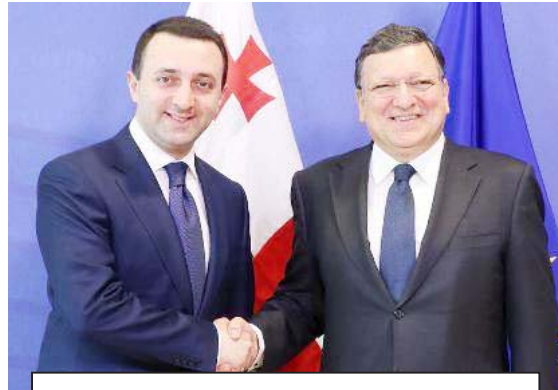
„იმიტომაც ვარ გაბრაზებული, რომ ძალიან მინდოდა დავსწრებოდი ბრიუსელში პრემიერის სამეფო სასახლეში მიღებას და ჩემი თვალთმენება ის ყველაფერი, რასაც მისი პრესსამსახური მე არ მომიყვება“

იყო საკრებულოს თავმჯდომარე, რომელსაც შეხვედრები ჰქონდა ბრიუსელის პარლამენტში, ბრიუსელის პარლამენტმა სურვილი გამოთქვა თანამშრომლობაზე, მათთვის არა აქვს მნიშვნელობა, საკრებულოში მიხიაპული იქნება თავმჯდომარე თუ სხვა გვარის ადამიანი. მთავარი, თანამშრომლობის სურვილი გამოთქვა და როცა ფუნქციონირებს