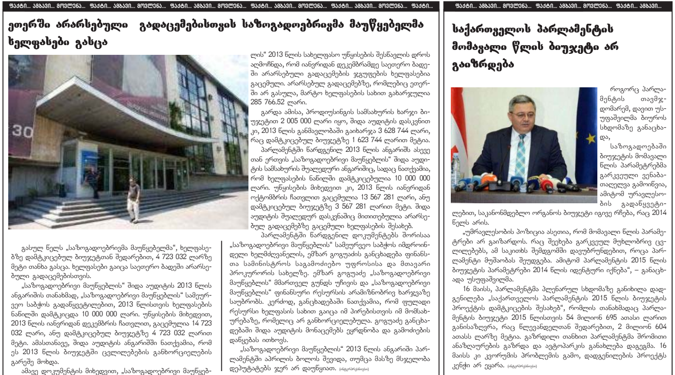
გაგრძელება მე-6 გვ.