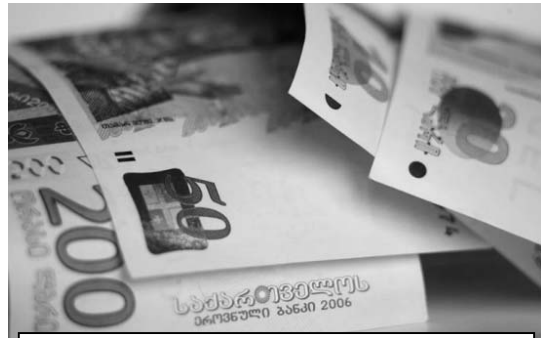
„ჩვენ ვიცით, რომ ეს მიკროსაფინანსოები ეროვნული ბანკისა და რომ მათ არავინ შეეხებათ. მე გამაგიჟა თავად ამ 720-მა პროცენტმა. ანუ ვილაცამ ამ საქმეში მილიონი ჩადო, წლის ბოლოს მიიღებს 7 200 000-ს წმინდა მოგებას“

არავინ შეეხებათ. მე გამაგიჟა თავად ამ 720-მა პროცენტმა. ანუ, ვილაცამ ამ საქმეში მილიონი ჩადო, წლის ბოლოს მიიღებს 7 200 000-ს წმინდა მოგებას. — მაგ თანხს ბეგარა გამოაკლავთ. — კაი, ბატონო, 20 პროცენტი დაიბეგრებოდა ეს თანხა და გამოეკლავთ მილიონ ოთხასი ათასი. კერძო მეგობრებში რომ იყვნენ, მათ მიმართ პარლამენტმა მიიღო კანონი, რომ მოსახლეობიდან ასაღები პროცენტი შეეზღუდათ, 36 პროცენტზე მეტს ვერ აიღებენ პირისგან, მაგრამ კანონში დარჩა ღრმული: ეს მათ შეუძლიათ 2000 ლარის ზემოთ შეიზღუდონ, 2000 ლარამდე კი რამდენსაც მიინდა, იმდენ პროცენტს დაეავდებ.