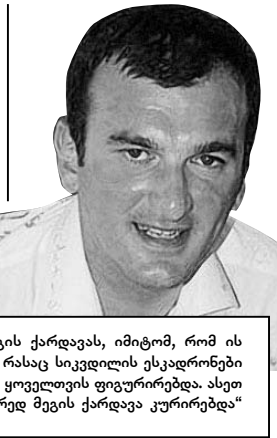
„გამოყოფო მეგის ქარდავას, იმიტომ, რომ ის მსგავს საქმეებში, რასაც სიკვდილის ესკადრონი ახორციელებდნენ, ყოველთვის ფიგურირებდა. ასეთი შემთხვევები სწორედ მეგის ქარდავა უკრირებდა“

გააჩერეს და არ გაგზავნეს ამერიკაში და რატომაც ომის პერიოდს დაემთხვა ასეთი ქმედება. ამას ემატება ომის პერიოდში ძალიან საეჭვოდ დადებული თვადაცვის კონტრაქტი, რომელსაც ხელს აწერდა თვადაცვის მინისტრის მოადგილე ბატონი მუჯირი, რომელიც ცხებოდა ვიქტორ ბუტის (იარალი უკრაინის ვაჭრობაში ექვემდინარეობილი და ბრალდებული) კომპანიონთან დადებული ხელშეკრულებას, რომელიც გულისხმობდა ქართული მხარის მხრიდან იარაღის შექმნას.