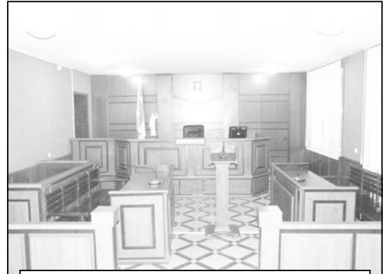
„უნდა შეექმნათ მექანიზმი, რომლითაც სასამართლოს უკანონო და პოლიტიკური განაჩენების შესწავლა უნდა მოხდეს... სასამართლო სისტემა უნდა შეიცვალოს, მოსამართლეების მიმართ მიუკერძოებლობის ნდობა უნდა იყოს და იგივე მოსამართლეებმა არ უნდა განიხილონ ეს საქმეები“

რომ უკან არ დაიხვეწენ და ანტი-სკრინაციული კანონის უკან გასაწევი ვად ყველაფერს გააკეთებენ. ბოლო დროს გქონიათ მათთან საუბარი?