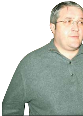
„გიგი, აღბათ, ძალიან ნაწიბს, რომ ქართველ ხალხს სული ვერ ამოხად, ნაწიბს, რომ შეკვეთილი მკვლელობები სისრულეში ვერ მოიყვანა, არადა ჩვენ გვახსოვს ბელორუსში განხორციელებული ზარები და შეკვეთილი მკვლელობები“

ვას გადაუხადა. კაპანაძემ სკანდალური განცხადება გააკეთა, ასევე, სააკაშვილის ბიძაზე: „მეშინოდა ვითარებიდან გამომდინარე, ე.წ. ლობის ძიება დავიწყეთ, ვიპოვეთ ლობი, ეს იყო თემურ ალასანი, რომელმაც მფარველობის სანაცვლოდ 2 მილიონი დოლარი მოითხოვა, ეს თანხა ქუშაძე ან ანგარიშზე უნდა მიეღო. ამის შემდეგ,