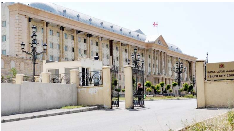
„მიჩივლეს და ამ სასამართლოს რომ ვუყურებ, ალბათ, მეც დამაჯარიმებენ. ამ დღეებში იქნება სასამართლო პროცესი. თითო პლაკატის გადაკერვა ჯარიმდება 1000 ლარით. არ ვიცი, რა იქნება...“

„სხვათა შორის, ჩემთან იყო რამდენიმე პიროვნება, რომლებმაც მითხრეს, რომ „ნაციონალბებ“ „ფრესკოს“ აყროლებულ ქათმებს არიგებენ მოსახლობაში. მე არ ვიცი, „ფრესკო“ ვისა, მაგრამ გეუბნები იმას, რაც მითხრეს“