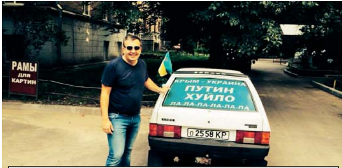
„ნაპრეზიდენტალ კაცს რატომ უნდა მოუხდეს „პუტინ ხუილოს“ ფონზე ფოტოს გადაღვა? სააკაშვილის ქვეცნობიერი გვეკითხება, აბა, გამოიცანით, ვინ უფრო დიდი „ხუილა“ — პუტინი თუ მიზა? პრინციპში, ორივე ერთი „ხუილა“ თავისი აკომპანიენტებით“