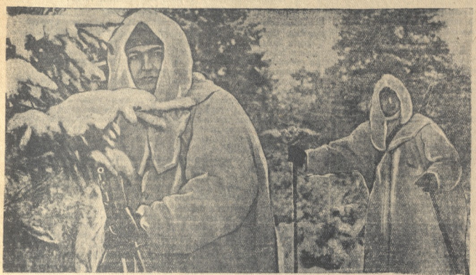
Боевая учеба в Красной Армии. НА СНИМКАХ: в лыжной разведке. (И-ская часть Ленинградского военного округа).