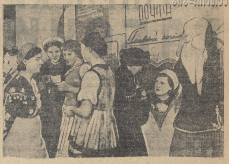
Бал-маскарад во Дворце культуры им. Ленина.

Свято соблюдают закон прияти, красивые дома скоро оборудуются и спокойные страны Советов, готовые в любой момент сорнуться и уничтожить любого врага, который посмеет посягнуть на интерес нашей социалистической родины.