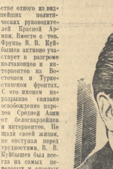
В. В. Куйбышев

Перед XIV партсъездом имеет, как указывал товарищ Сталин, общую черту период подготовки Октябрьской социалистической революции: «Эта общность состоит в том, что оба эти периода отражают революционный момент в развитии нашей революции».