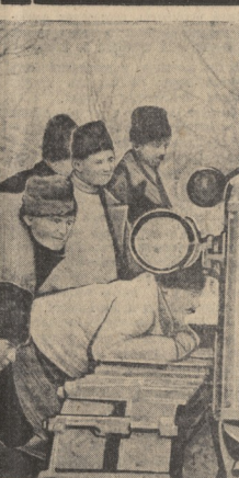
Каждый день в Молдавскую ССР прибывают десятки новых тракторов, которые прямо с вокзалов отправляются во вновь организованные МТС и колхозы республики. На снимке колхозники выданы организованного колхоза «Новая жизнь» (село Кылмыкы, Каушский район, Бендерский уезд) осматривают первый трактор, прибывший для обслуживания колхозно-колхозной компании.

ПАРТИННАЯ ЖЕНЬ. Р. Романова — На строительных площадках. Профгосфортор. А. Рашка — Без перемены. В. Иушарин — Важнейший участок работы парторганиза — 2 стр. — 2 БИБЛИОГРАФИЯ. По страницам журналов — 2 стр. СВУДЖЕНСКИЙ РАЙОН — УЧАСТИЕ ВЫСТАВКИ. И. Еременко — За новые успехи в 1941 году. С. Умурашадзе — По старому уезду. П. Польшко — Трудовая