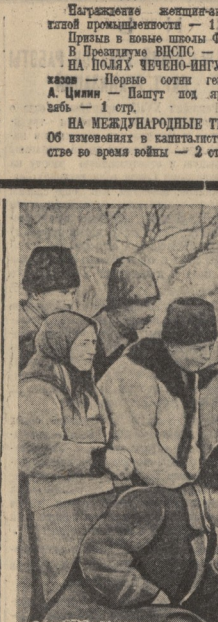
Каждый день в Молдавскую ССР прибывают десятки новых тракторов, которые прямо с вокзалов отправляются во вновь организованные МТС и колхозы республики. На снимке колхозники выданы организованного колхоза «Новая жизнь» (село Кылмыкы, Каушский район, Бендерский уезд) осматривают первый трактор, прибывший для обслуживания колхозно-колхозной компании.

Наркомхоз РСФСР предложил коммунальным отделам проверить заключенные с застройщиками договоры, пролив их действие до установленного законом срока. (ТАСС).