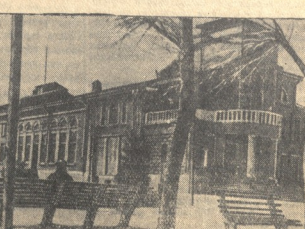
В городском парке у здания клуба.