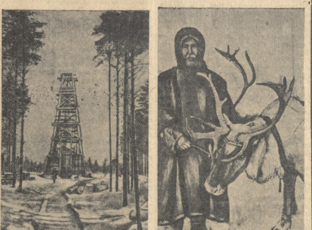
В таких местах Верхне-Таврической области (Свердловская область), еще недавно безлюдных и глухих, теперь полным ходом идет разведочная работа на нефть. На снимке: первая буровая вышка Верхне-Таврической разведочной партии Наркомнефти.