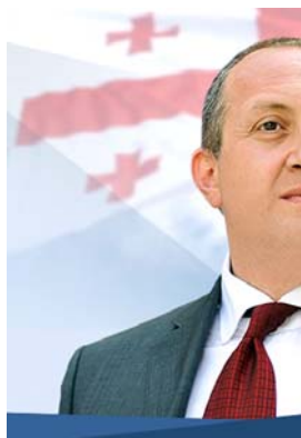
„მარგველაშვილი ქართველ ხალხს მამინ შემოვლანუნა, როდესაც ქვეყნის ინტერესებზე მალა პირადი კავშირები დაყავ იმ ადამიანთა წრესთან, ვინც „სიკვილის ესკადრონი“ წესად აქცია. მატყავარანის ძმის კლივილას სახელში დაჯდომით მან დაამტკიცა, რომ პრეზიდენტების არჩევამ ქართველებს ბედი არ გაეპყ“

ორი, საქართველოს მისადგომებთან ასანით ხელში გაიყვანა ნორვეგიის დარბის, ნიოელ საზზე თამაში თავის დაწვით არ დაასრულოთ.