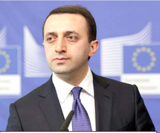
„ნაციონალისტები“ მონად წოდებულმა ლუსის ნავარომ ბოლო „საჩუქარი“ დაუტოვა ქართველ ხალხს და სამომხედო გეგმა გაშიფრა, რომლის მიხედვითაც, პრეზიდენტი მარგველაშვილი და ირაკლი ალასანი რეიტინგულ ფიგურებად შემოგვტანა და პრემიერი? ლუსის ნავაროს დაავიწყდა, რომ ლარბაშვილის მინისტრთა კაბინეტის წევრია ირაკლი ალასანი და თუკი მისი მინისტრები კარგად მუშაობენ და რეიტინგულები არიან, ეს მათი ხელმძღვანელის დამსახურებაა“

მოკლედ, ასეა თუ ისეა, დიდი ალიაკოთია და კვამლი რომ უცეცხლოდ არ ჩნდება, ამას ფაქტები მონიშნის. ეს არ არის პირველი პრეცედენტი, როდესაც მარგველაშვილი თვითნებურ გადაწყვეტილებებს იღებს, მანამდე იყო საფრანგეთის დაანონსებული ვიზიტი და შემდეგ თურქეთში გამგზავრების საკითხი, თუ ვინ უნდა ნასულიყო თურქეთის პრეზიდენტის, ერდოღანის ინაულგურაციაზე, პრემიერი თუ პრეზიდენტი. მოკლედ, 27 მაისს პრეზიდენტის ადმინისტრაციამ ოფიციალურად გამოაცხადებინა ინფორმაცია, რომ საქართველოს პრეზიდენტი, საფრანგეთის პრეზიდენტის ფრანსუა ოლანდის მოწვევით, 14 ილისს საფრანგეთს ესტუმრება. მარგველაშვილის საფრანგეთის „ვიზიტი“ დეტალური არ გამაზურებულა. ახლა კი გეტყვით, რომ მარგველაშვილი პარიზში არავის უნახავს ჩასული, ამის შემდეგ არც თავად მარგველაშვილის ადმინისტრაციას გაუკეთებია განმარტება, თ რატომ შედგა ვიზიტი და არც არავის მოუთხოვავს ეს ამბავი. რეალობა კი იყო ის, რომ საფრანგეთიდან არავითარი მოწვევა არ მოსულა მარგველაშვილის სახელზე და არც ასეთი რაწების სტუმრის ჩასვლას ითხოვდა საფრანგეთი. ერთია, რომ პრეზიდენტს უკვე ჩვევაში გადაუვიდა „პაუზების“ სკანდალი და მეორეა რეალობა. უფუნქციოდ დარჩენილი მარგველაშვილი საერთაშორისოდ დადგენილ წესებს იგნორს უკეთებს და საერთაშორისო კავშირებს უფარო საქმეთა