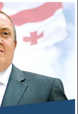
„მარგველაშვილი ქართველ ხალხს მამინ შემოვლანუნა, როდესაც ქვეყნის ინტერესებზე მალა პირადი კავშირები დაყავ იმ ადამიანთა წრესთან, ვინც „სიკვილის ესკადრონი“ წესად აქცია. მატყავარანის ძმის კლივილას სახელში დაჯდომით მან დაამტკიცა, რომ პრეზიდენტების არჩევამ ქართველებს ბედი არ გაეპყ“

რესაც, კონსტიტუციაში არის ხარვეზი, არ არის დაზუსტებული, რა შემთხვევაში ენიჭება პრიორიტეტი პრეზიდენტს და რა შემთხვევაში პრემიერ-მინისტრს. ეს ხარვეზი, ალბათ, გამოსწორდება, თუ პრეზიდენტსაც და პრემიერსაც აქვს მონვევა, სასურველი იქნება, მოხდეს მათ შორის შეთანხმება და ერთობლივად გაემტავროსო.