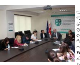
იყოს შრომის ბაზრის მართვის საინფორმაციო სისტემაში მისამართზე WWW.WORKNET.GOV.GE.

ასევე რეგისტრაციისთვის პირებს შეუძლიათ მიაკითხონ სოციალური მომსახურების სააგენტოს ტერიტორიულ ცენტრებსა და ცენტრალურ ოფისს. რეგისტრაცია 25 ათას ადამიანს შეეძლება, დამსაქმებელი კომპანიების რიცხვი კი დაახლოებით 150-180-მდეა. რეგისტრაცია 19 სექტემბრის 24.00 საათზე სრულდება. (ნოზიძე)