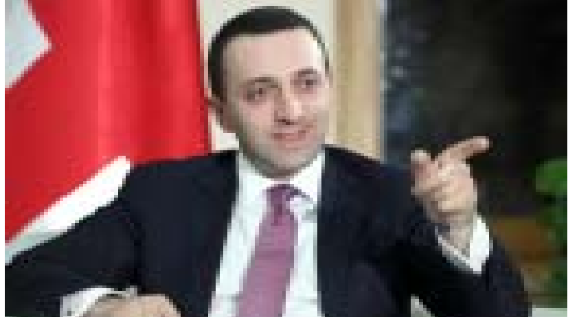
„ირაკლი ლარიაშვილს აქვს იმდენი მარიფათი და საშუალება, რომ მარგველაშვილს პასუხი გასცეს, არ არის საჭირო ამდენი ვაზღვინაშვილი დეპუტატი და ხელისუფლების სხვადასხვა შტოებიდან დახმარება. ვითომ ირაკლის პატივისცემული დეპუტატები ისე უნდა მოიქცნენ, რომ სიტუაცია განიმუხტოს. ესენი ცეცხლზე ნავთს ასხამენ, არ არის ირაკლი ის კაცი, პასუხი ვერ გასცეს ვინმეს და რამე შეარჩინოს“

„როგორც კი ხელისუფლებას უჭირს, მაშინვე წინა პლანზე გამოდის ბიძინა ივანიშვილი და იწყებს ლაპარაკს. დღეს რამდენიც არ უნდა ვილაპარაკოთ და უარყვიოთ, ეს ადამიანი არის ხელისუფლებისა და საზოგადოების გენერატორი, მაგრამ ვერ იქნება ცოცხი, რომლითაც „ნაციონალუბი“ უნდა გახვეტო, ეს საქმე მთავრობის, მინისტრებისა და საზოგადოების გასაკეთებელია“