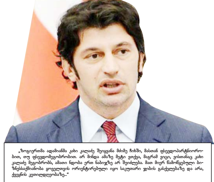
„ზოგიერთმა ადამიანმა კახი კალაძე შეიყვანა მძიმე ჩიხში, მასთან ფსევდოპარტნიორობით, თუ ფსევდოპეგობრობით. არ მინდა ამაზე მეტი ვთქვა, მაგრამ ვიცი, ვისთანაც კახი კალაძე მეგობრობს, ამათი ნდობა ერთ ნაბიჯზე არ შეიძლება. მათ მიერ წამოწყებული ბიზნესსაქმიანობა ყოველთვის ორიენტირებული იყო საკუთარი ჯიბის გასქელებაზე და არა, ქვეყნის კეთილდღეობაზე...“