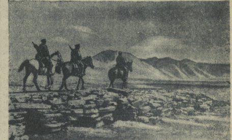
Гравюра СССР на Париже. ИА. СНИМКИ: пограничники. Фотохис ТАСС.

ВВП(б): — Всесоюзный съезд ВВП(б) — 2 стр. На подступах и весеннему сезону: Х. Васильев — Доложное время, И. Барановичев — В Кашар-Арговок МТС — 3 стр. Н. Васильев — Не борются за экономия топлива и тепла — 3 стр. И. Бегоньев — Возоблаждение Малгобека пот угляры ормыа — 3 стр. ШЫБМА В РЕДАКЦИЮ — 3 стр. Республикаские курорты в 1940 году — 4 стр. Стахановцы завода «Арсенал» — 4 стр. Ленин и Сталин в чечено-ингушском доходе — 4 стр. ФИЗКУЛЬТУРА И СПОРТ — 4 стр. Инструкторы телеграммы: Война в Западном Европе. Война на море. Карательная экспедиция в Вазариате — 4 стр.