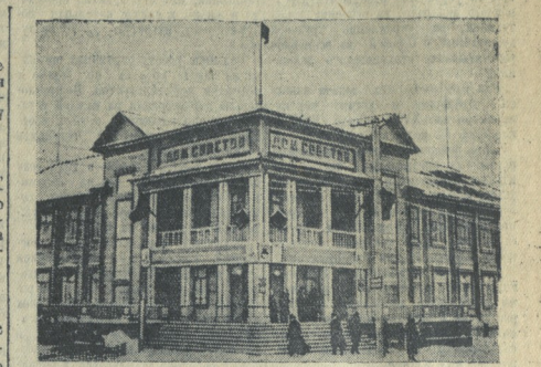
В 1936 году, в Архангельской области на пустынном берегу Белого моря началось строительство города. Города был назван Молотовским. Строительство должно быть закончено в 1941 году. НА СНИМКЕ: дом Советов в г. Молотовском.

Наши авиация вела активные действия по войскам и военным объектам противника, при этом сбросила 8 самолетов противника.