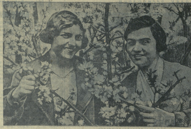
Среди цветущих деревьев...