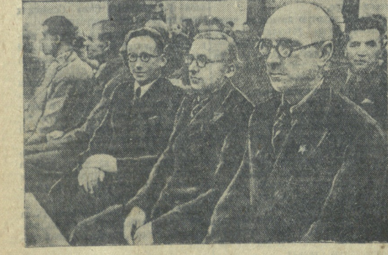
Делегация эстонского народа в зале заседания.

Теперь эта стена уничтожена. Широкие массы трудящихся Эстонии убедились, что власть эстонской буржуазии была властью врагов народа, что она была против всего творческого, против всего благого, что есть в нашем народе. Эта власть завела страну в тупик. Производительные силы страны не развивались и